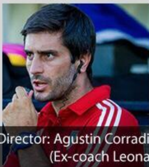
Director: Agustin Corradini (Ex-coach Leonas)

¡Sportshowcase y PlayintheUS hacen tu sueño realidad !